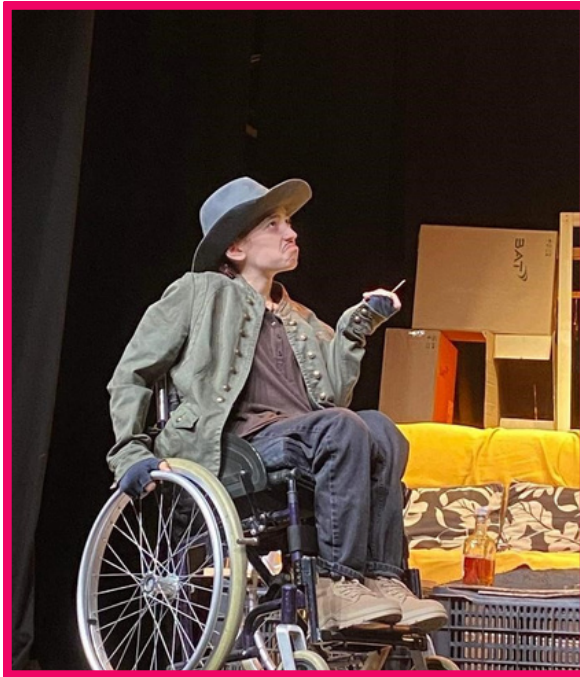
© ბათუმის ინკლუზიური თეატრი-„ყველას უყვარს ოპალი“