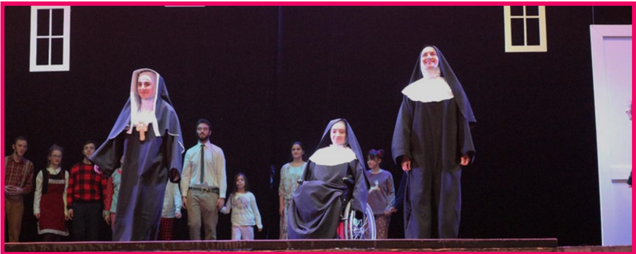
© ბათუმის ინკლუზიური თეატრი - „მუსიკის ჰანგები“

ინფრასტრუქტურული ბარიერი, არის ყველაზე დიდი ბარიერი, რაც აფერხებს შშმ ახალგაზრდებს დაესწრონ სახვადასხვა კულტურულ/სახელოვნებო ღონისძიებებს ან თავად ჩაერთონ მსგავსს ღონისძიებებში.